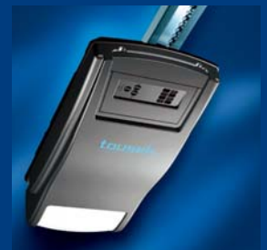
tousek Garagentorantriebe sparsam und schnell