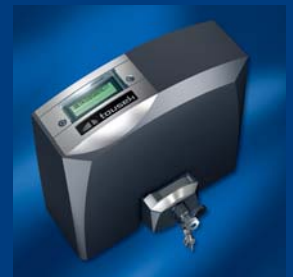
tousek Schiebetorantriebe kompakt und sicher

CZ-130 00 Praha 3, Jagellonská 9 Tel: +420/ 222 090 980 Fax: +420/ 222 090 989 Email: info@tousek.cz