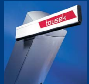
tousek Schrankensysteme formschön und robust