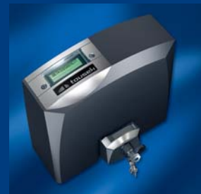
tousek Schiebetorantriebe kompakt und sicher

CZ-130 00 Praha 3, Jagellonská 9 Tel: +420/ 222 090 980 Fax: +420/ 222 090 989 Email: info@tousek.cz