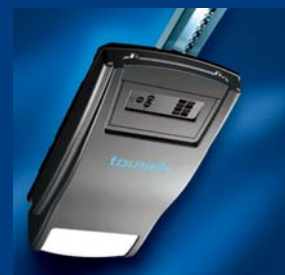
tousek Garagentorantriebe sparsam und schnell