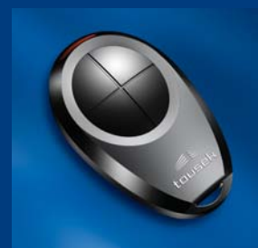
tousek Impulsgeberprogramm kompatibel und sicher