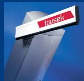
tousek Schrankensysteme formschön und robust