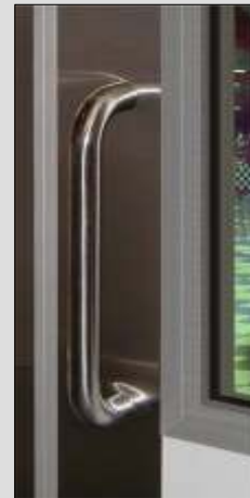
Optional Stoßgriffe und Schonbleche aus Edelstahl.