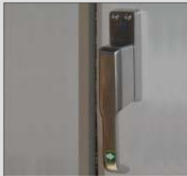
Optional Verriegelung des Standflügels über Treibriegel.