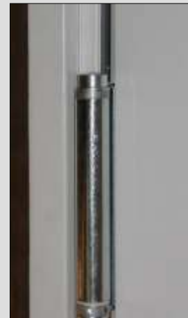
Verzinkte Pendeltürbänder, doppelseitig wirkend.