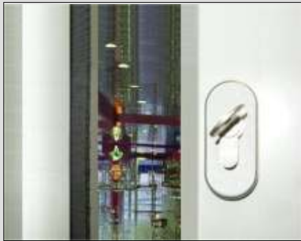
Optional mit Verriegelung über PZ-Schloß nach oben und unten.