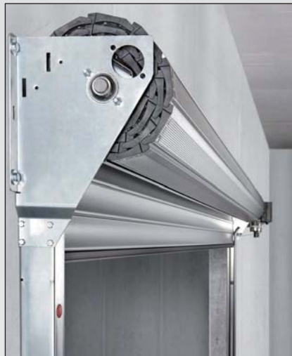
Der Rolltorpanzer ist auf der Wickelwelle vormontiert und kann problemlos in die Konsole eingebaut werden. Die platzsparende Konsole ist mit der Führungsschiene verschraubt – aufwändiges Aufmessen und Anzeichnen kann so entfallen.