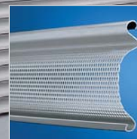
Rolltorprofil 6010 visio „easy“