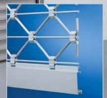
Rollgitter TG-X „easy“