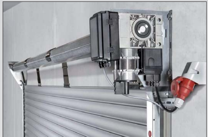
Die vorverdrahtete Steuerung ist in den zuverlässigen Markenantrieb integriert. Die komfortable Bedienung erfolgt über einen steckerfertig vorverdrahteten 3-fach-Taster.

Das neue Teckentrup Rolltorsystem „easy“ zeichnet sich durch eine unkomplizierte und robuste Konstruktion aus. Einzelne Bauteile wurden intelligent vereinfacht und optimal aufeinander abgestimmt. Aufwändige Aufmessarbeiten, z.B. für die Konsolenbefestigung und Wickelwellenposition, entfallen. Zusätzlich wird der Einbau durch die Vorverdrahtung von Steuerung und Antrieb erleichtert. Im Vergleich zu herkömmlichen Toranlagen können so bis zu 40% Montagezeit eingespart werden.