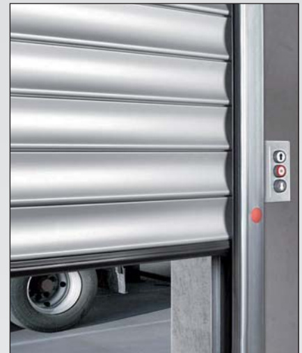
Vorgelochte Führungsschienen erleichtern die Montage. Die Bodendichtung ist in das letzte Profil integriert und sorgt so für eine harmonische Optik innen und außen.