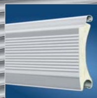
Rolltorprofil ThermoTeck „easy“