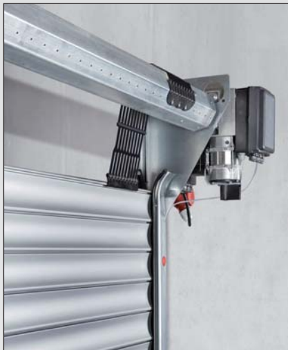
Langlebiges und hochfestes Anbindungssystem zwischen Welle und Torpanzer (Teckentrup Schutzrecht). Die 8-Kant-Wickelwelle inkl. Lagerzapfen ist vollständig verzinkt.