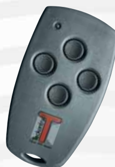
„Mini“ 4-Kanal- Handsender

Mit jeder zusätzlichen Taste der Mehrkanal-Fernsteuerung können z.B. ein zweites Garagentor, das Hoftor oder die Beleuchtung in der Einfahrt gesteuert werden.