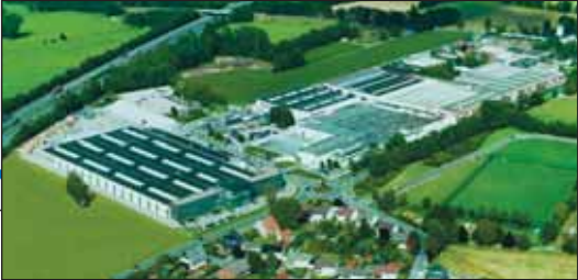
Hauptverwaltung Werk Verl-Sürenheide