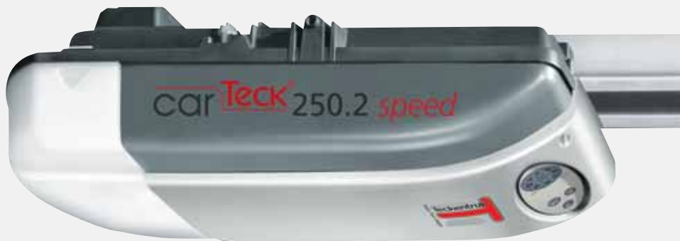
CarTeck Antrieb 250.2 „speed“: Öffnet schneller als herkömmliche Antriebe.