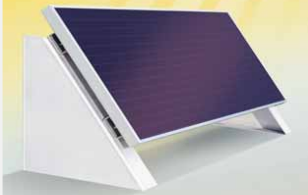
CarTeck 211 Akku-Solarmodul: Einfach zu befestigen. Maße: 585 x 340 x 225 mm, Gewicht: 4,3 kg.

Bei dem Antriebssystem CarTeck 211 accu-solar entfällt das manuelle Aufladen des Akkus. Er wird durch ein Solarmodul, das z.B. auf dem Garagendach zu platzieren ist, von der Sonne mit Strom versorgt.