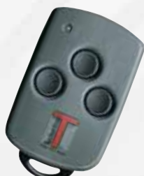
„Mikro“ 3-Kanal- Handsender