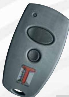
„Mini“ 2-Kanal- Handsender